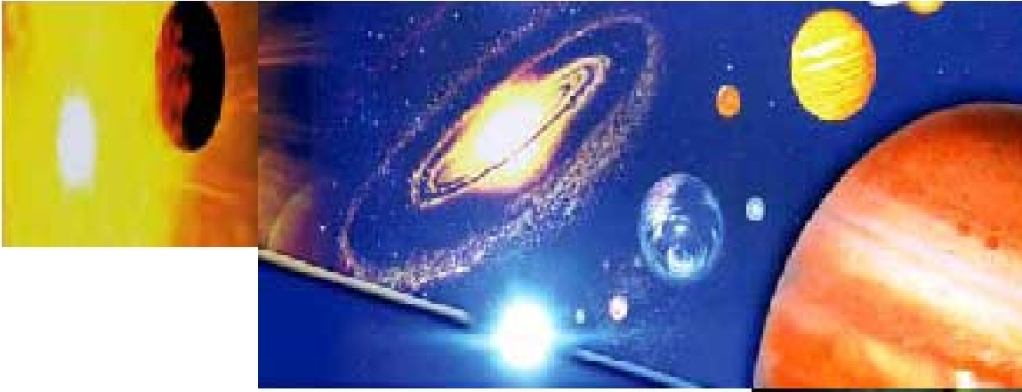
Kainat ve Dünyanın Kıyametini temsil eden resim.

Cuma, 16 Nisan 2010 16:52 - Son Güncelleme Salı, 05 Mayıs 2020 14:27