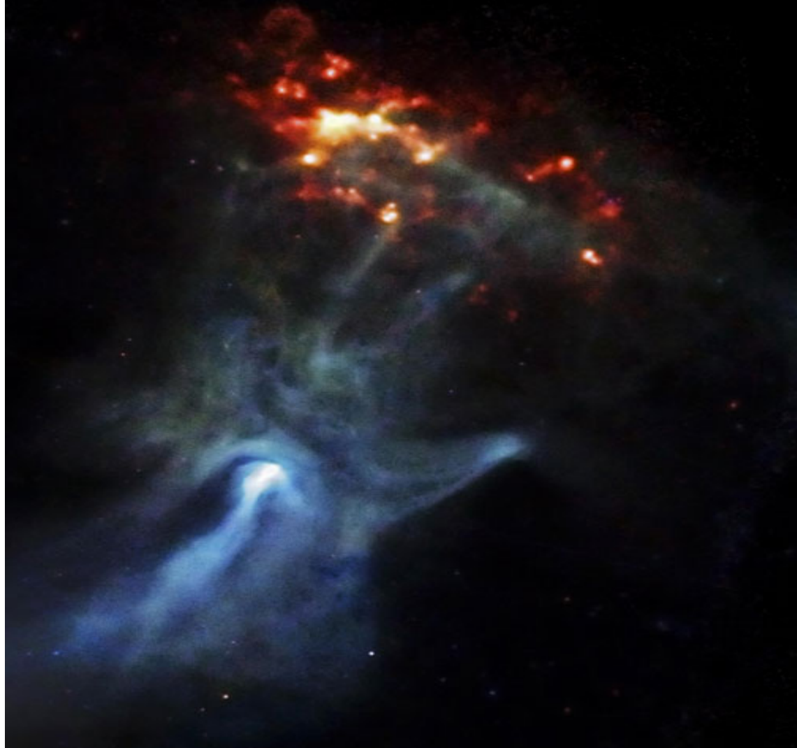
14 Şubat 2010