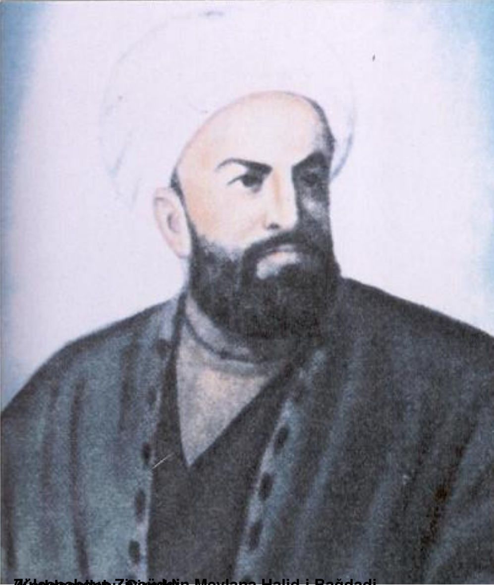
(Çağdaşlar Ziyat) Mevlana Halid-i Bağdadi

Pazar, 07 Mart 2010 15:58 - Son Güncelleme Salı, 05 Mayıs 2020 14:40