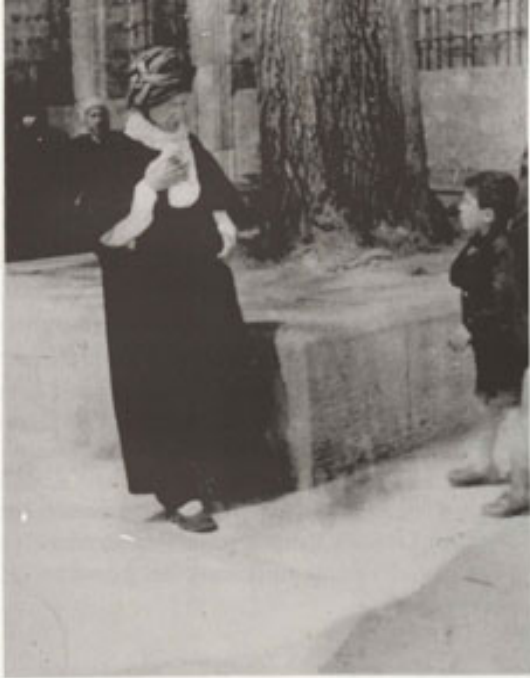
Üstad Bediüzzaman 1952 İkbaharında Fatih Camilinin avlusunda bir çocukla konuşurken.