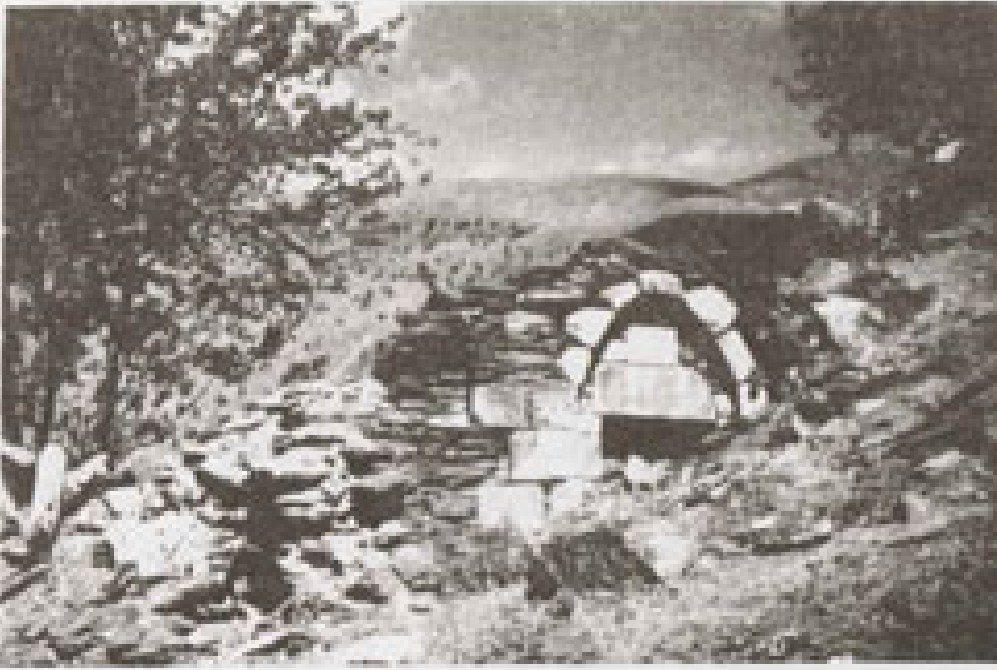
Üstadın ilk tahsilini almaya başladığı Nurs köyü yakınlarındaki Taş Medresesi harabeleri

Cumartesi, 06 Mart 2010 20:23 - Son Güncelleme Salı, 05 Mayıs 2020 14:38