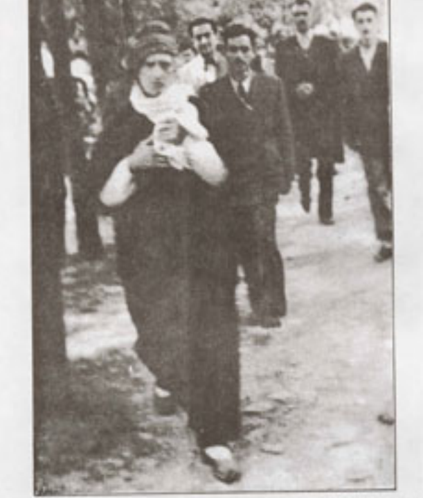
Üstad Bedüzzaman 1952 yılında, Gençlik Rehberi Mahkemesi münasebetiyle İstanbul'a geldiğinde Fatih Camii Şerifinden çıkarken talebeleriyle birlikte görülüyor.

Cumartesi, 06 Mart 2010 20:23 - Son Güncelleme Salı, 05 Mayıs 2020 14:38