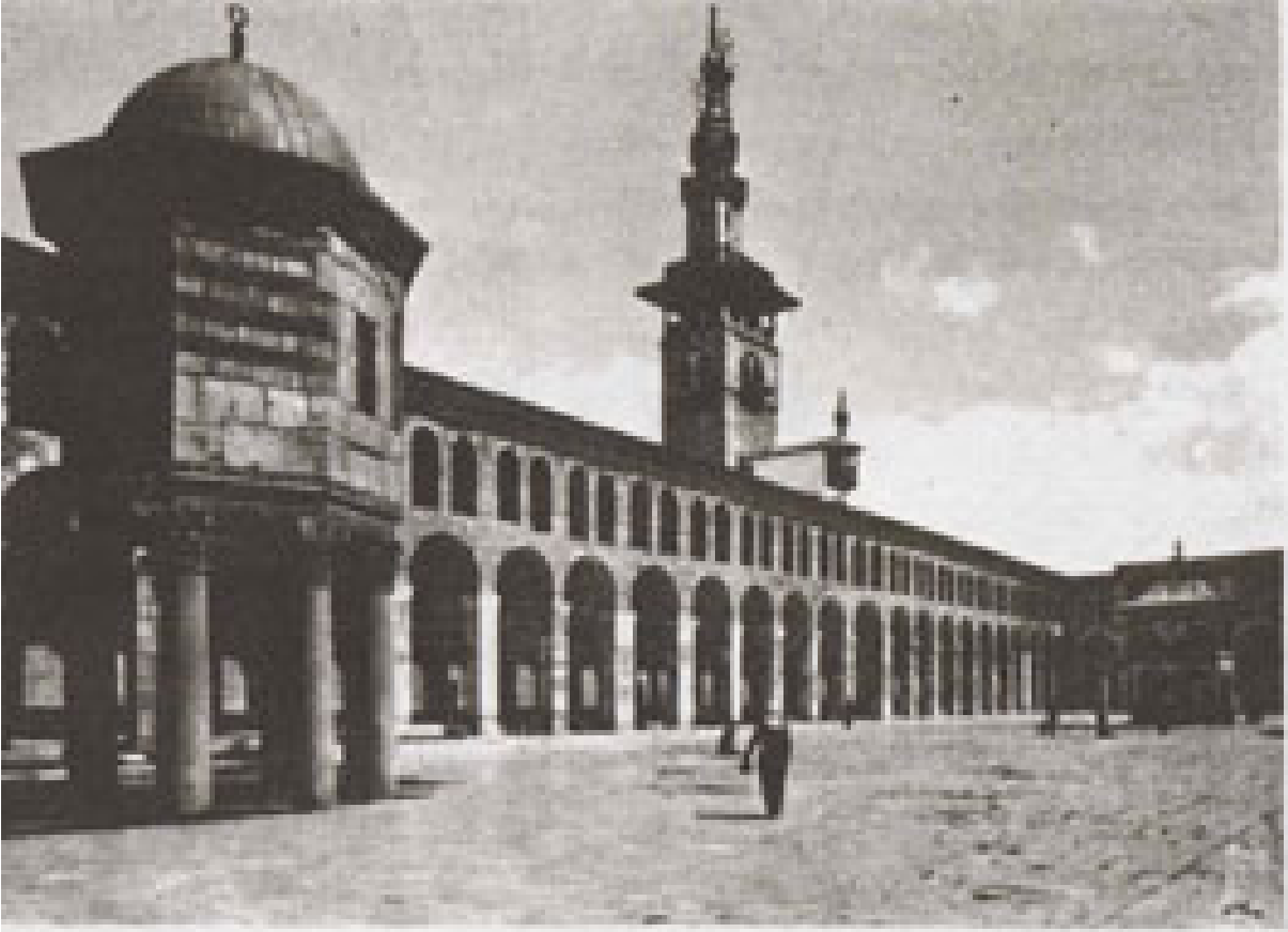
Şam Emeviye Camilinin avlu ve bir minaresinin görünüşü

Cumartesi, 06 Mart 2010 20:23 - Son Güncelleme Salı, 05 Mayıs 2020 14:38